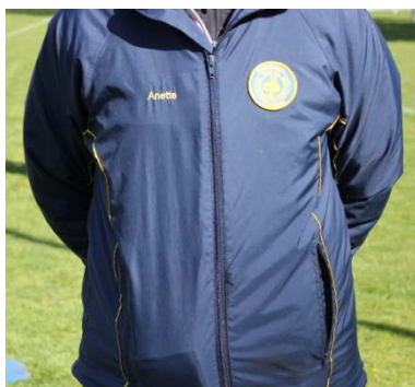
Broderat märke och namn