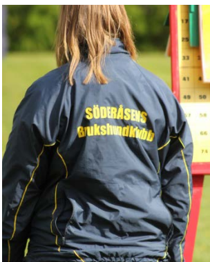
Ryggtryck och ryggficka